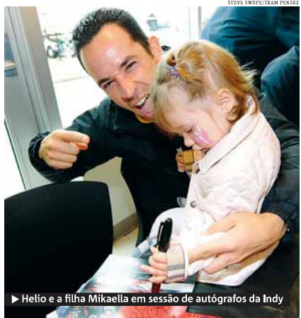
► Helio e a filha Mikaela em sessão de autógrafos da Indy

É isso aí, amigos, vamos que vamos e até a próxima semana! www.twitter.com/h3lio e press@heliocastroneves.com .