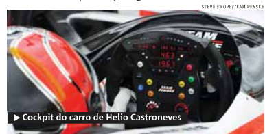
► Cockpit do carro de Helio Castroneves

Mas, sobre o título, que torço bastante para ser conquistado pelo meu companheiro de Team Penske Will Power, e as questões da Austrália, eu vou entrar em mais detalhes na semana que vem. Por enquanto, fica aqui o meu abraço, desejo de bom feriado, e vou nessa porque tenho de arrumar as malas para Detroit, Las Vegas, Austrália... Deixo meus contatos: www.twitter.com/h3lio e press@heliocastroneves.com