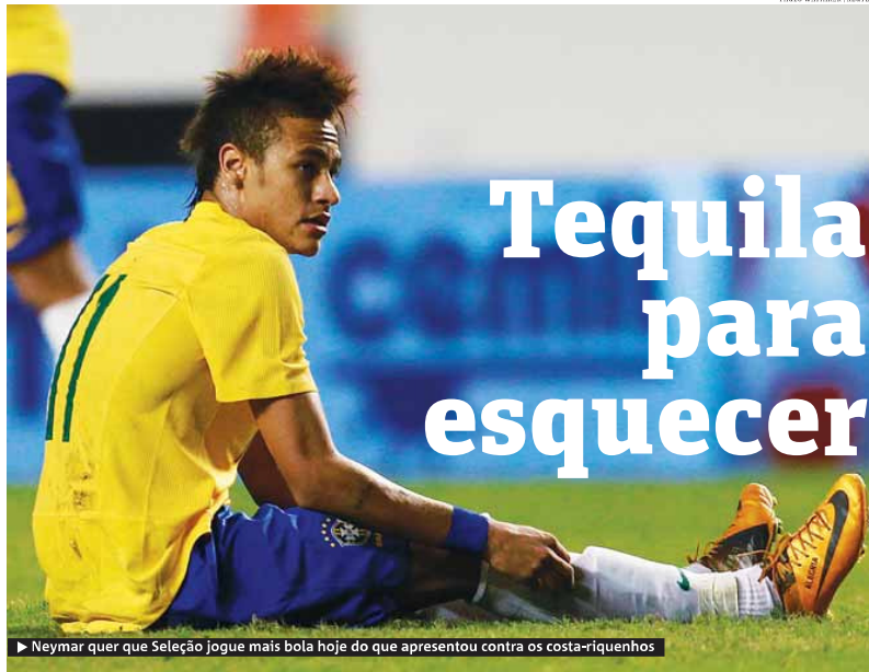
► Neymar quer que Seleção jogue mais bola hoje do que apresentou contra os costa-riquenhos