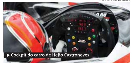
► Cockpit do carro de Helio Castroneves