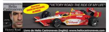
Victory Road Livro de Helio Castroneves (Inglês): www.heliocastroneves.com