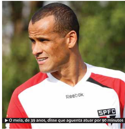
► O meia, de 39 anos, disse que aguenta atuar por 90 minutos

► Técnico são-paulino diz que meia é um dos titulares, mesmo ficando na reserva ► Luis Fabiano fará sua reestrea domingo contra o Flamengo