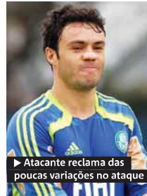
► Atacante reclama das poucas variações no ataque