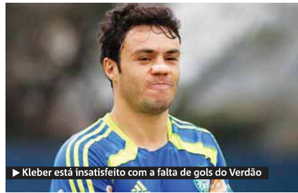
► Kleber está insatisfeito com a falta de gols do Verdão