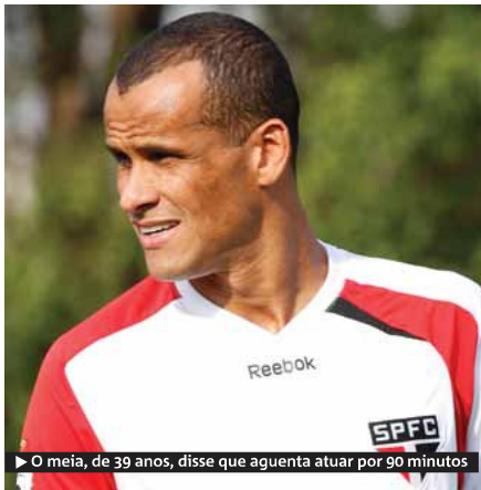
► O meia, de 39 anos, disse que aguenta atuar por 90 minutos

► Técnico são-paulino diz que meia é um dos titulares, mesmo ficando na reserva ► Luis Fabiano fará sua reestreia domingo contra o Flamengo