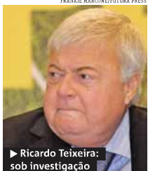
► Ricardo Teixeira: sob investigação