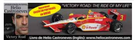
Victory Road Livro de Helio Castroneves (Inglês): www.heliocastroneves.com