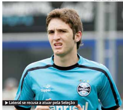
▶ Lateral se recusa a atuar pela Seleção