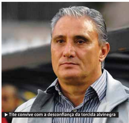
▶ Tite convive com a desconfiança da torcida alvinegra