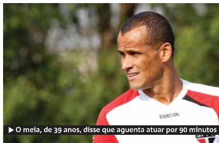
O meia, de 39 anos, disse que aguenta atuar por 90 minutos