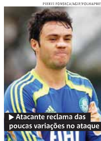
Atacante reclama das poucas variações no ataque