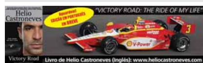
Victory Road Livro de Helio Castroneves (Inglês): www.heliocastroneves.com