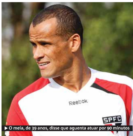
► O meia, de 39 anos, disse que aguenta atuar por 90 minutos

► Técnico são-paulino diz que meia é um dos titulares, mesmo ficando na reserva ► Luis Fabiano fará sua reestreia domingo contra o Flamengo