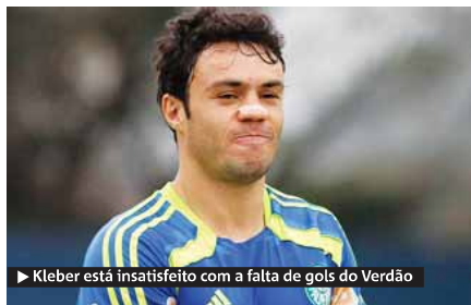
► Kleber está insatisfeito com a falta de gols do Verdão