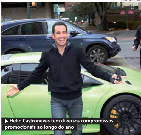
► Helio Castroneves tem diversos compromissos promocionais ao longo do ano