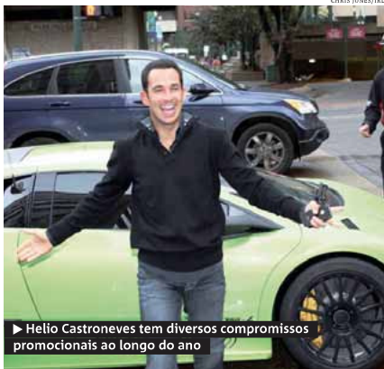
► Helio Castroneves tem diversos compromissos promocionais ao longo do ano