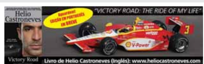
Victory Road Livro de Helio Castroneves (inglês): www.helioastroneves.com