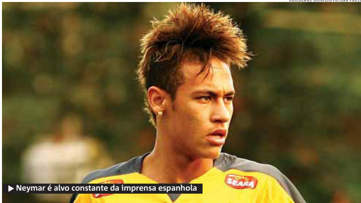
Neymar é alvo constante da imprensa espanhola

O santista Neymar é um dos nomes mais comentados na imprensa espanhola. Depois de o jornal "Marca" anunciar que o craque se apresentaria ao Real Madrid no dia 20 de dezembro, agora foi a vez do "As" afirmar que dirigentes do time merengue aproveitarão a estadia do