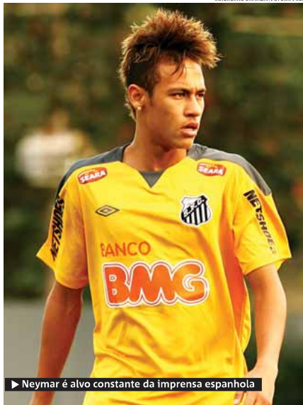
► Neymar é alvo constante da imprensa espanhola

O jogador desfalca o Peixe no jogo de quarta-feira, contra o Corinthians, em partida adiada da 5ª rodada do Brasileiro, para servir à Seleção. METRO