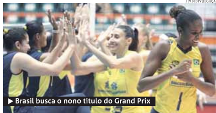
► Brasil busca o nono título do Grand Prix

A Tailândia é a primeira adversária sexta-feira, às 9h (de Brasília). No dia seguinte, a equipe comandada pelo técnico José Roberto Guimarães enfrentará o Cazaquistão, às 6h15. E, encerrando a fase, o Brasil jogará contra a Itália no domingo, novamente às 9h. METRO RIO