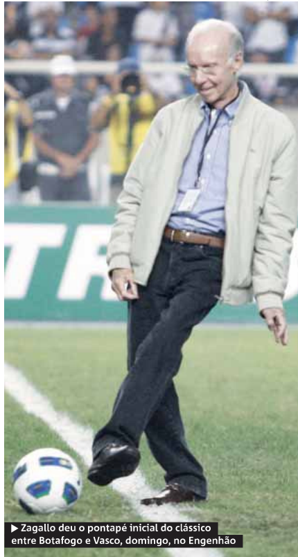
► Zagallo deu o pontapé inicial do clássico entre Botafogo e Vasco, domingo, no Engenhão