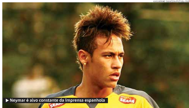
► Neymar é alvo constante da imprensa espanhola

► Time de Madrid pretende fechar compra da joia esta semana ► Atletia diz que Barça é o melhor time do mundo