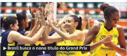
► Brasil busca o nono título do Grand Prix