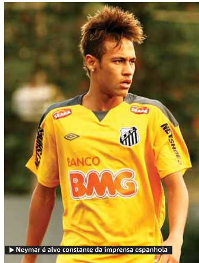
► Neymar é alvo constante da imprensa espanhola