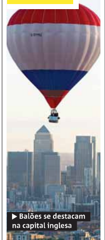
► Balões se destacam na capital inglesa