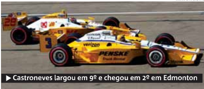
► Castroneves largou em 9º e chegou em 2º em Edmonton