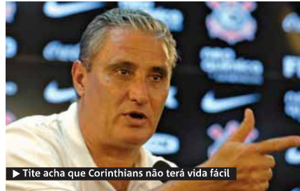
► Tite acha que Corinthians não terá vida fácil

De folga na rodada deste meio de semana - venceu o Inter em jogo antecipado - a equipe de Tite volta a campo domingo, contra o Avaí, penúltimo colocado. No dia 3 de agosto, recebe o América-MG, 18º. E no dia 7, em Curitiba, joga com o Atlético-PR,