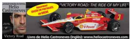
► Felipão não escondeu irritação após derrota para o Fluminense domingo, fora de casa