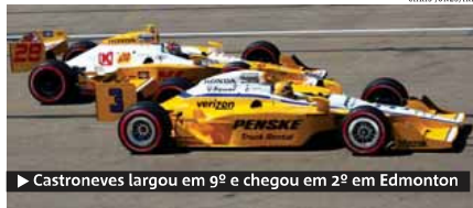
► Castroneves largou em 9º e chegou em 2º em Edmonton