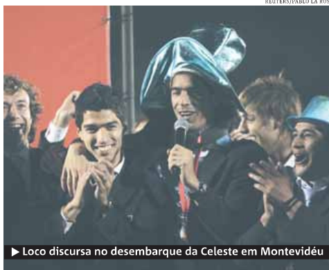
► Loco discursa no desembarque da Celeste em Montevideú

Cerca de 20 mil pessoas aguardavam o desembar-