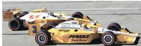
► Castroneves largou em 9º e chegou em 2º em Edmonton