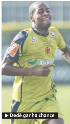
► Dedé ganha chance