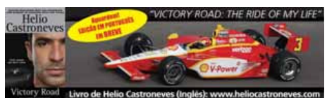
Livro de Helio Castroneves (Inglês): www.heliocastroneves.com