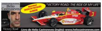
Victory Road Livro de Helio Castroneves (Inglês): www.heliocastroneves.com