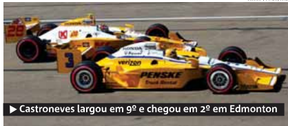
► Castroneves largou em 9º e chegou em 2º em Edmonton