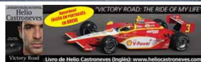
Victory Road - Livro de Helio Castroneves (Inglês): www.helioastroneves.com