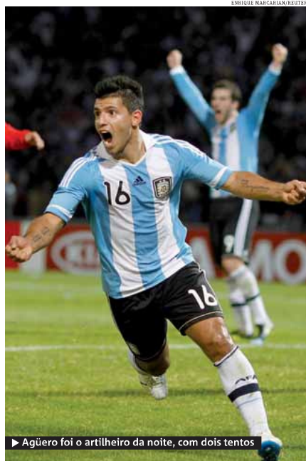
► Agüero foi o artilheiro da noite, com dois tentos

► Argentina faz 3 a 0 na Costa Rica e está classificada ► Agüero marca dois e Di Maria completa o placar ► Messi dá show no meio de campo