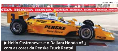
► Helio Castroneves e o Dallara Honda nº 3 com as cores da Penske Truck Rental

Perdi quatro voltas nos pits até conseguir voltar à pista. Chegar em 17º, completando 81 das 85 voltas, foi o que se mostrou possível. O negócio é voltar as atenções para Edmondson, de "grandes histórias", e virar esse jogo. Até a próxima semana e abração a todos! www.twitter.com/h3lio e press@helioastroneves.com.