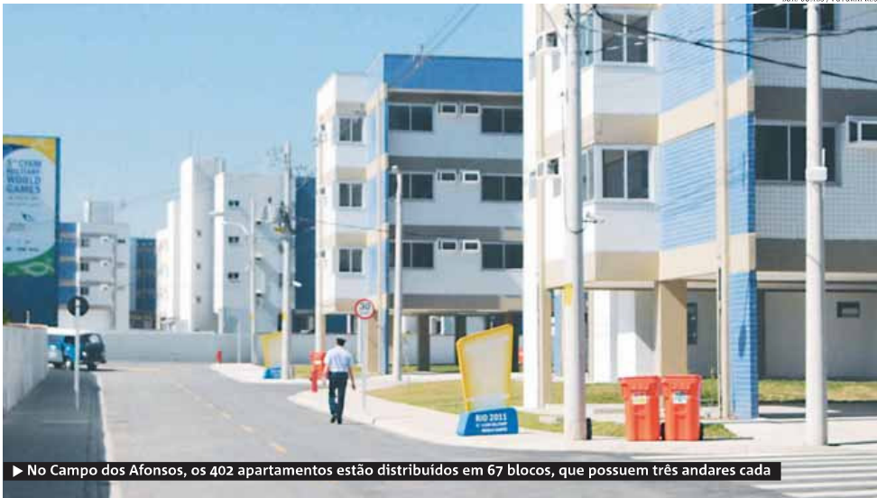
► No Campo dos Afonsos, os 402 apartamentos estão distribuídos em 67 blocos, que possuem três andares cada