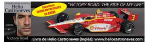
Victory Road Livro de Helio Castroneves (Inglês): www.heliocastroneves.com

Perdi quatro voltas nos pits até conseguir voltar à pista. Chegar em 17º, completando 81 das 85 voltas, foi o que se mostrou possível. O negócio é voltar as atenções para Edmondson, de "grandes histórias", e virar esse jogo. Até a próxima semana e abração a todos! www.twitter.com/h3lio e press@heliocastroneves.com.