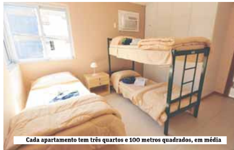
Cada apartamento tem três quartos e 100 metros quadrados, em média