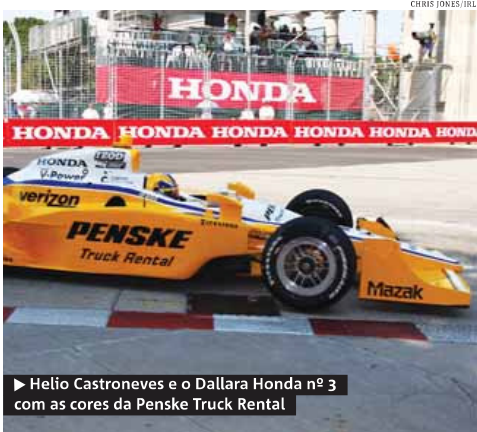
► Helio Castroneves e o Dallara Honda nº 3 com as cores da Penske Truck Rental

Perdi quatro voltas nos pits até conseguir voltar à pista. Chegar em 17º, completando 81 das 85 voltas, foi o que se mostrou possível. O negócio é voltar as atenções para Edmonton, de "grandes histórias", e virar esse jogo. Até a próxima semana e abração a todos! www.twitter.com/h3lio e press@helioastroneves.com.