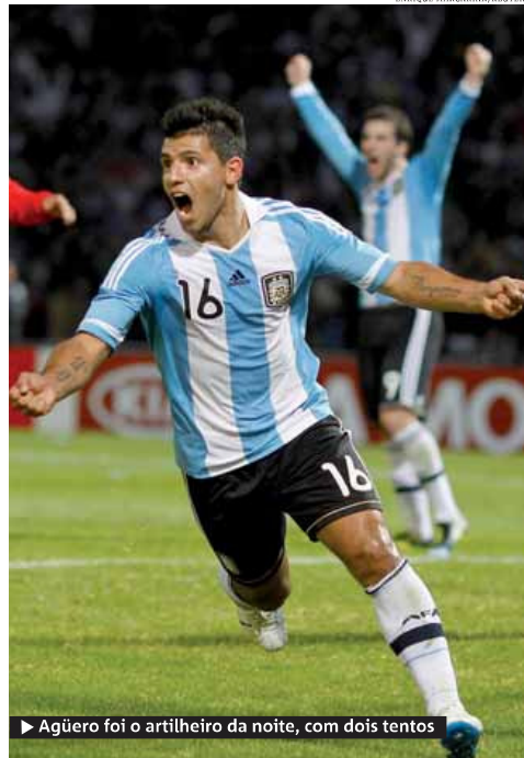
► Agüero foi o artilheiro da noite, com dois tentos

► Argentina faz 3 a 0 na Costa Rica e está classificada ► Agüero marca dois e Di Maria completa o placar ► Messi dá show no meio de campo