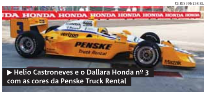
► Helio Castroneves e o Dallara Honda nº 3 com as cores da Penske Truck Rental