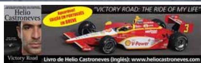
Victory Road Livro de Helio Castroneves (Inglês): www.heliocastroneves.com