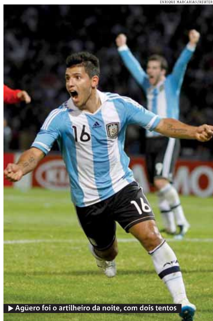
► Agüero foi o artilheiro da noite, com dois tentos

► Argentina faz 3 a 0 na Costa Rica e está classificada ► Agüero marca dois e Di Maria completa o placar ► Messi dá show no meio de campo