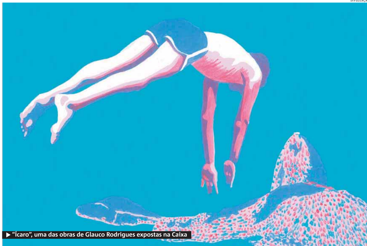
► "Ícaro", uma das obras de Glauco Rodrigues expostas na Caixa

► Caixa Cultural abre hoje exposição que abrange todas as fases da carreira do pintor gaúcho, cujo estilo foi consagrado no Brasil e no exterior