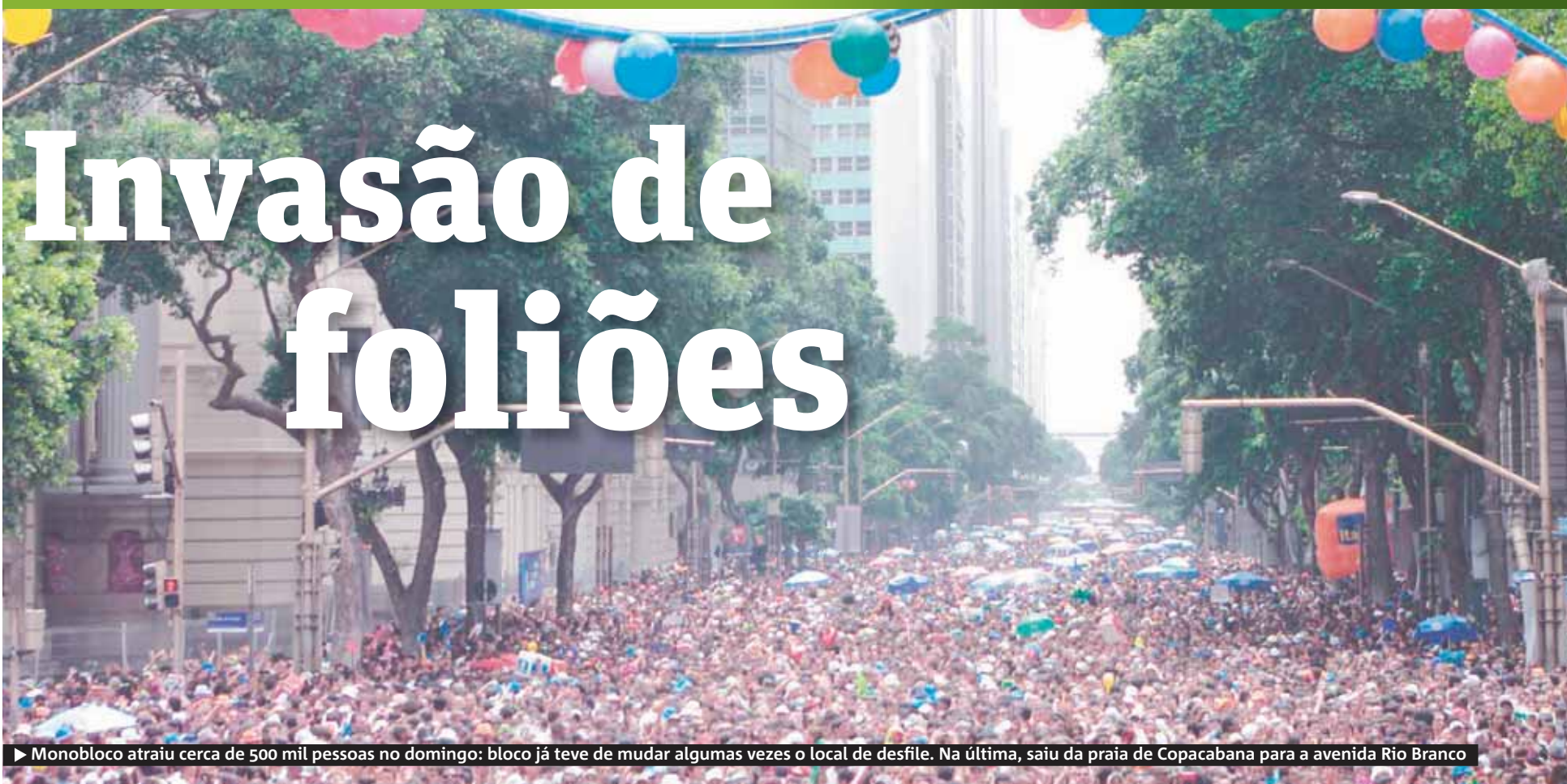
► Monobloco atraiu cerca de 500 mil pessoas no domingo: bloco já teve de mudar algumas vezes o local de desfile. Na última, saiu da praia de Copacabana para a avenida Rio Branco