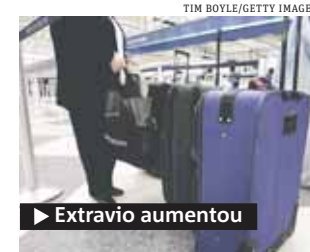
► Extravio aumentou

nuarão em R$ 19,22. Todas as outras taxas foram fixadas no valor máximo permitido. ● METRO