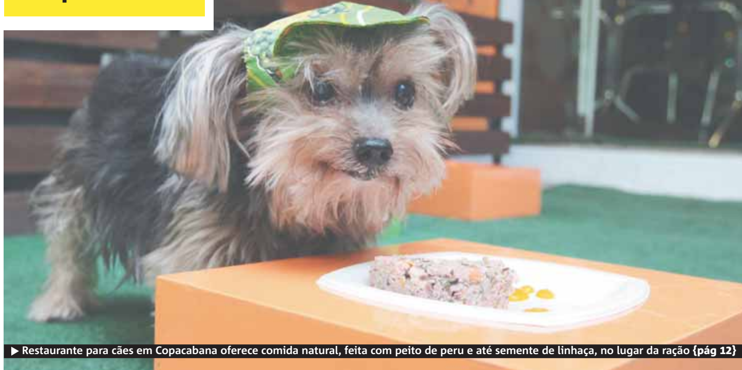
► Restaurante para cães em Copacabana oferece comida natural, feita com peito de peru e até semente de linhaça, no lugar da ração {pág 12}