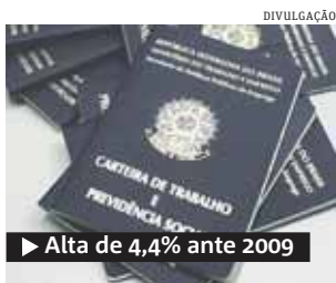
► Alta de 4,4% ante 2009

Foram pagos R$ 20,44 bilhões em seguro-desemprego no ano passado, informou o Ministério do Trabalho. O volume é novo recorde histórico e representa um aumento de 4,4% em relação a 2009, quando o pagamento so-