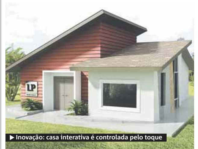
► Inovação: casa interativa é controlada pelo toque