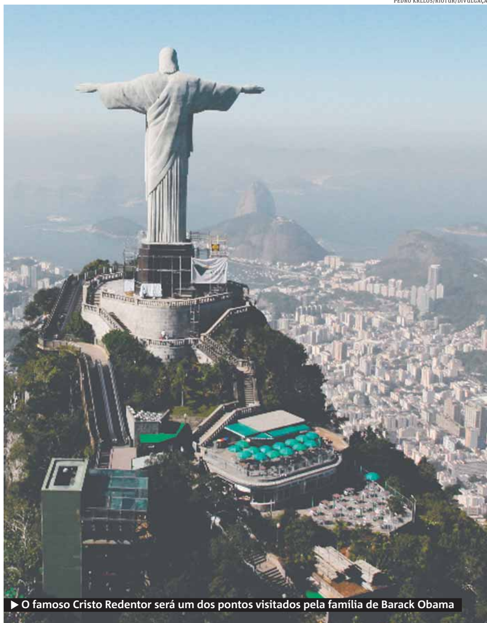
▶ O famoso Cristo Redentor será um dos pontos visitados pela família de Barack Obama

▶ Presidente americano visita o Rio no domingo e discursa na Cinelândia ▶ Evento terá tradução simultânea