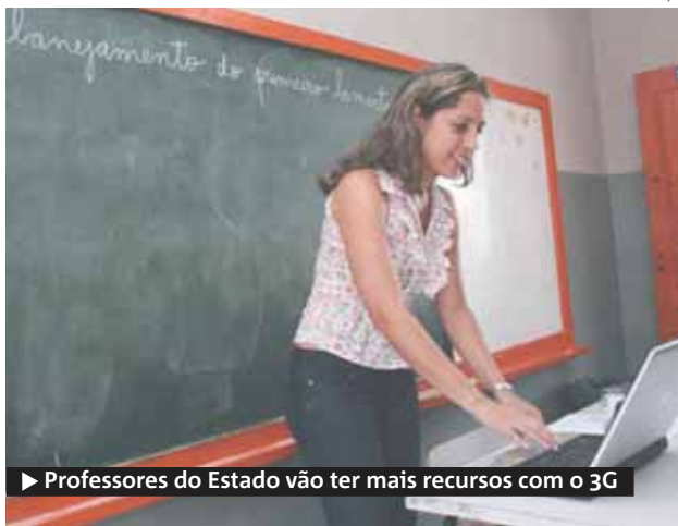
▶ Professores do Estado vão ter mais recursos com o 3G