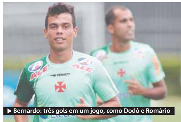
► Bernardo: três gols em um jogo, como Dodô e Romário

Artilheiro da Copa São Paulo de 2009 pelo Cruzeiro, onde chegou aos 12 anos de idade, ele teve poucas chances com Adilson Batista no clube mineiro, devido às seguidas contu-