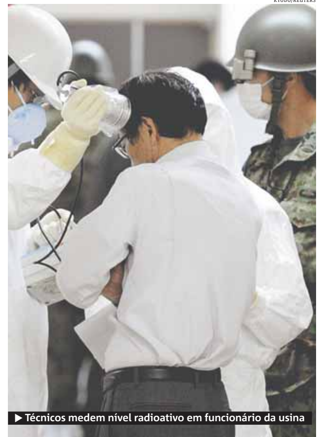
► Técnicos medem nível radioativo em funcionário da usina