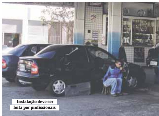
Instalação deve ser feita por profissionais

A caixa selada com subwoofer funciona para potencializar a função grave do som. As cornetas são usadas para reforçar o mé-