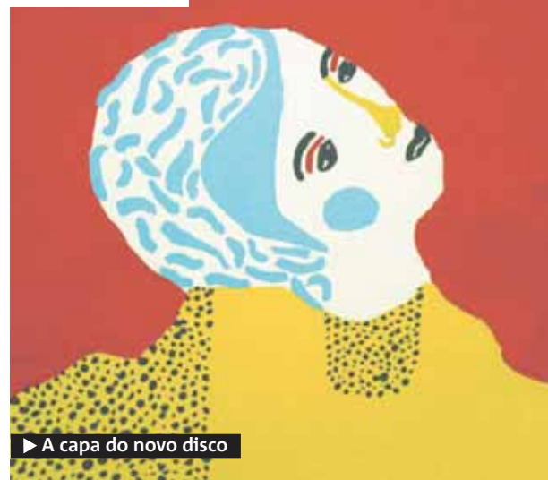
► A capa do novo disco