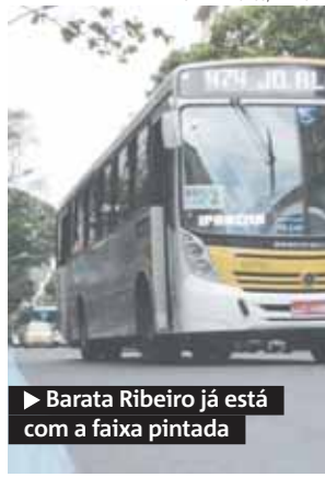
▶ Barata Ribeiro já está com a faixa pintada