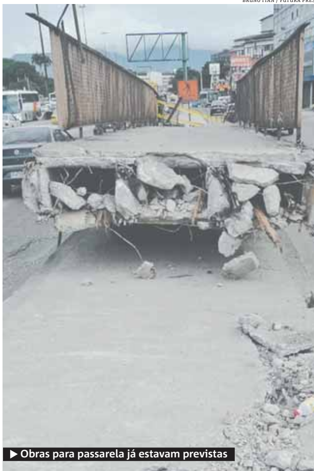
▶ Obras para passarela já estavam previstas

milhões é aproximadamente o valor da nova passarela que será construída na avenida Brasil. As obras já estavam previstas antes do acidente com o ônibus e a licitação já foi feita.