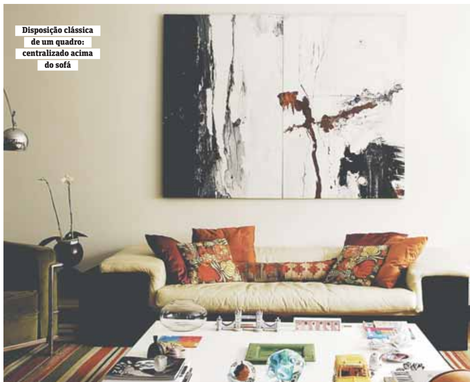
Disposição clássica de um quadro: centralizado acima do sofá