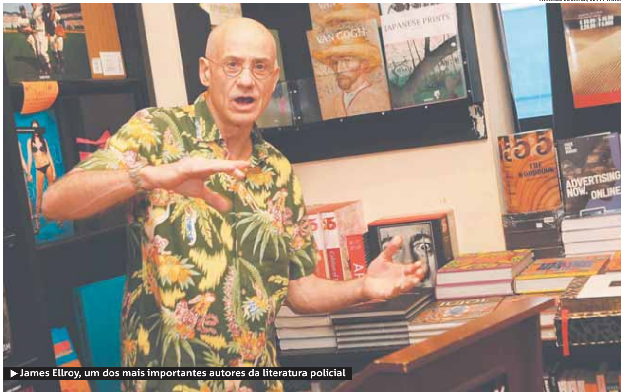
► James Ellroy, um dos mais importantes autores da literatura policial

► James Ellroy, consagrado autor de 'Los Angeles - Cidade Proibida' e 'Dália Negra', romances adaptados para o cinema, tem presença confirmada na Flip 2011 ► Evento literário homenageará neste ano o escritor brasileiro Oswald de Andrade