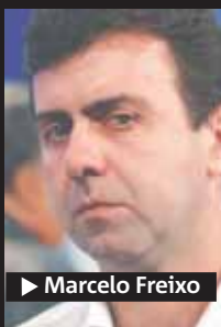
▶ Marcelo Freixo

A Comissão Parlamentar de Inquérito (CPI) para investigar o tráfico de armas no Estado foi instalada ontem na Alerj. "O parlamento precisa dar a sua contribuição para uma questão grave, que é o tráfico de armas", diz o deputado Marcelo Freixo (PSOL), que preside a CPI.