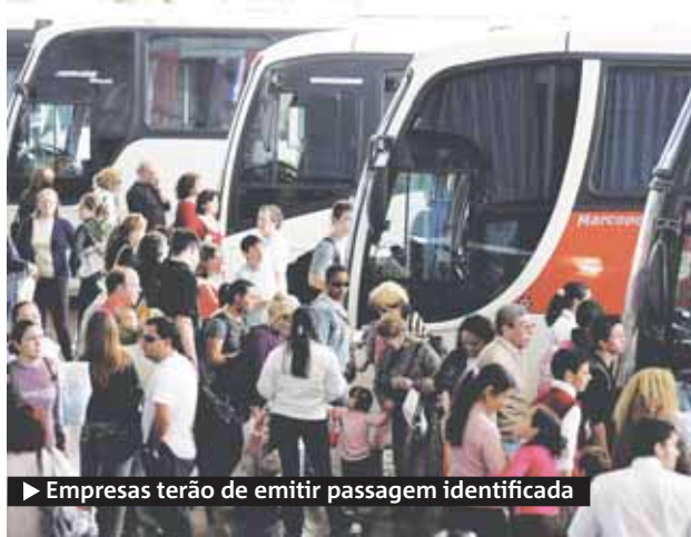
► Empresas terão de emitir passagem identificada