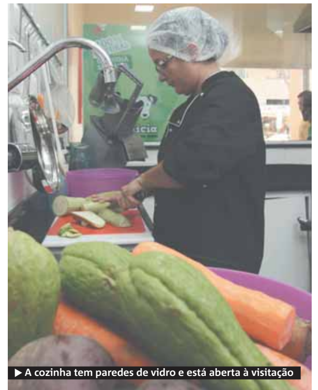
► A cozinha tem paredes de vidro e está aberta à visitação