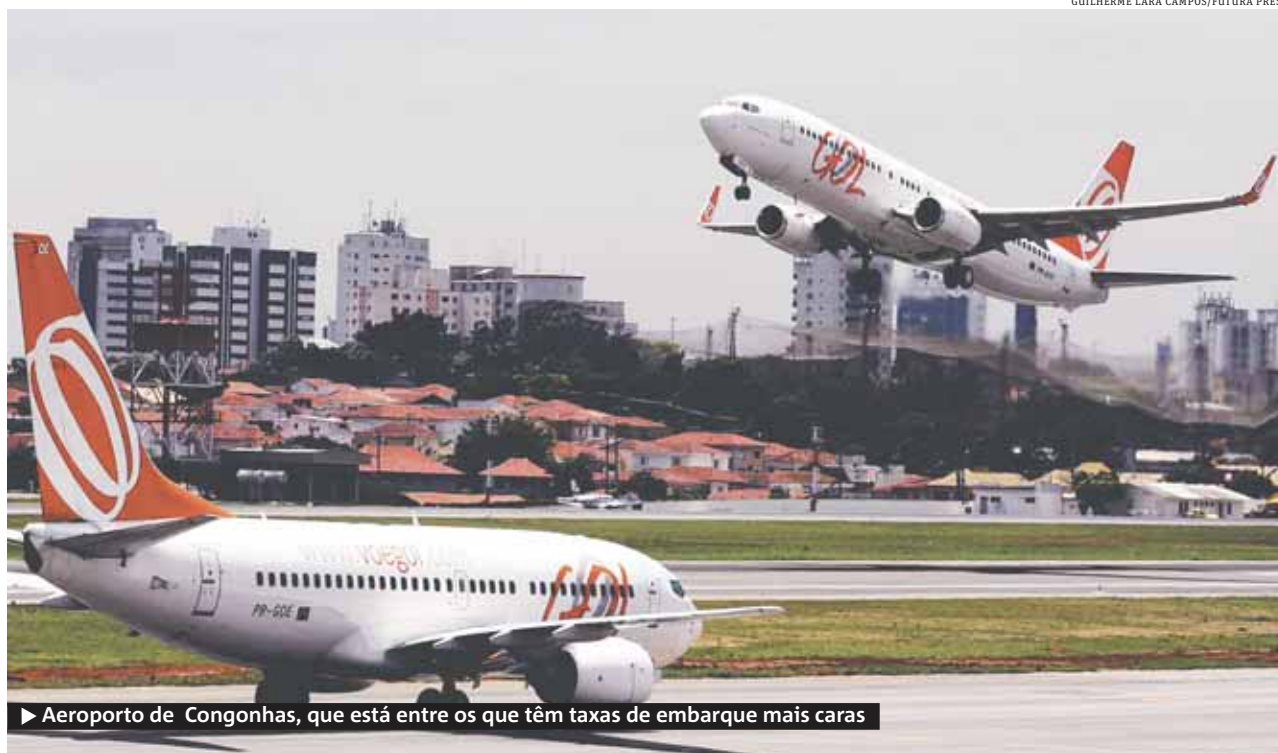
► Aeroporto de Congonhas, que está entre os que têm taxas de embarque mais caras

A taxa de embarque, no entanto, agora poderá variar, já que a nova regra da Anac permite que o aereo-